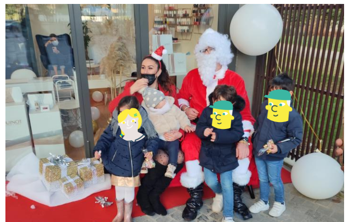
Les commerçants partenaires de l'opération : Maison Lejeune, Optic 2000, Koala Pressing, Pokawa, Le Caviste de La Rue, Chez Gabin, Barber Town, Institut Reyana