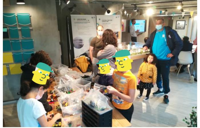
Les ateliers Lego ont rencontré un succès fou et ont rassemblé une dizaine de jeunes du quartier!