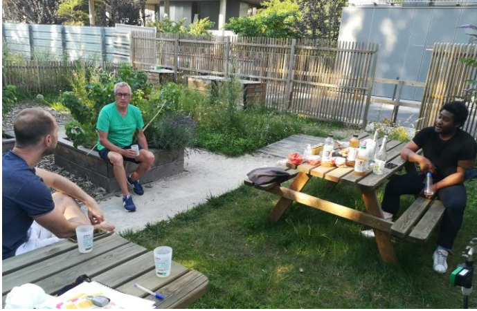
L'été dernier, nous avons proposé des moments conviviaux les jeudis soirs dans le jardin partagé.