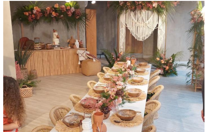
La décoratrice EmilieEvents a transformé le lieu dans le cadre d'une privatisation. Magique !