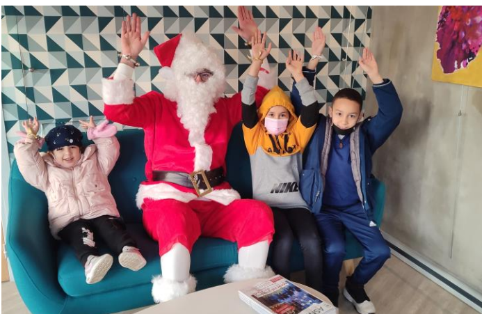
Les commerçants du quartier se sont associés pour organiser une animation de fin d'année. Chaque commerce a joué le jeu en recevant le Père Noël dans sa boutique