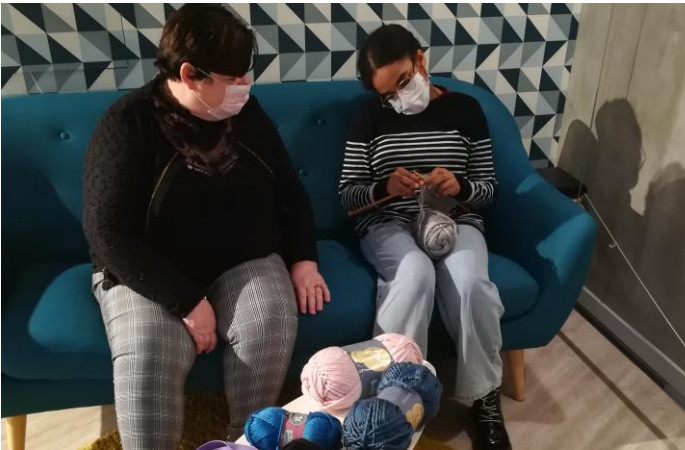
L'atelier tricot proposé par l'Association L'Effet Main a eu lieu fin novembre. Les prochains ateliers auront lieu les derniers samedis du mois !