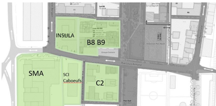
Riverains concernés par restrictions d'accès

Durant 3 jours, du 21 au 23 août, les accès aux parkings privés rue Louis Armand ouest seront condamnés entre 8h00 et 18h00. (bâtiments Insula, Sky & Garden, Soho, SCI les caboeufs )